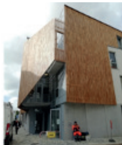
2 logements + 1 maison médicale + 1 consultation ONE

En 2019, les vadémécums des 2 bâtiments suivants ont été rédigés :